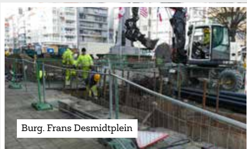
Burg. Frans Desmidtplein

De heraanleg van het Burg. Frans Desmidtplein is voorzien vanaf september 2019.