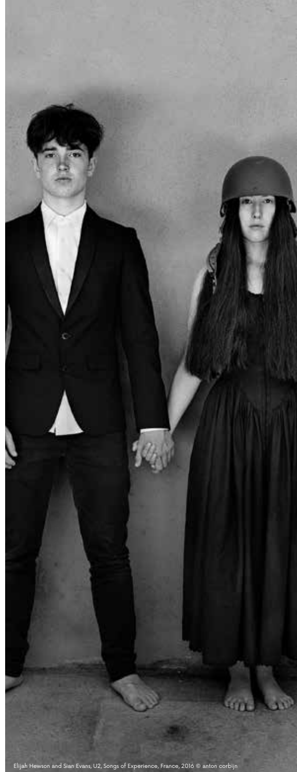
Elijah Hewson and Sian Evans, U2, Songs of Experience, France, 2016

€ 15 / € 10 KH & Vlaanderen Uitpas, groep +4 pers. / -18 jaar gratis